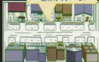
整正作業による雪置き場所のイメージ