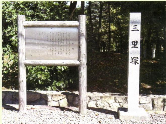
平岡南公園前に建つ三里塚碑と説明板