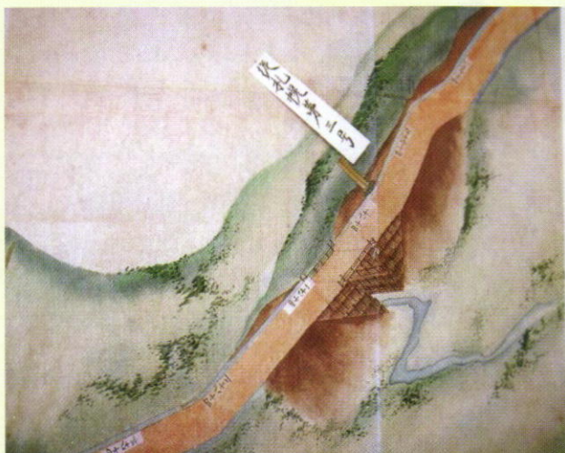
「新道出来形絵図」に描かれた三里塚。 三里川のほとりに三里標が建っている