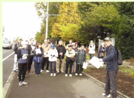
三里塚歴史さんぽの様子

里塚・美しが丘地区センターが2025年10月10日、あしりべつ郷土館の協力で、まち歩き講座「三里塚歴史さんぽ」を開催しました。