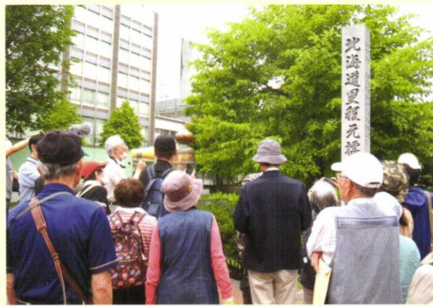
北海道里程元標（モニュメント）前で＝創成橋たもと

札幌本道とは、開拓使が明治6年（1873年）に開削した函館から札幌（森-室蘭間は海路）までの北海道最初の幹線道路（馬車道）で、清田区内は今の「旧道」（北野-里塚）に当たります。札幌本道のうち札幌-室蘭間は「室蘭街道」とも呼ばれ、国道36号のルートです。